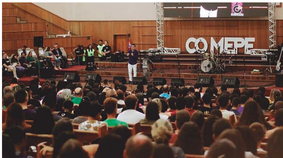
Um dos eventos mais tradicionais é o Congresso de Mocidades Evangélicas Pentecostais (Comepe), realizado pela Assembleia de Deus Ministério de Anápolis, e que mobiliza milhares de pessoas todos os anos