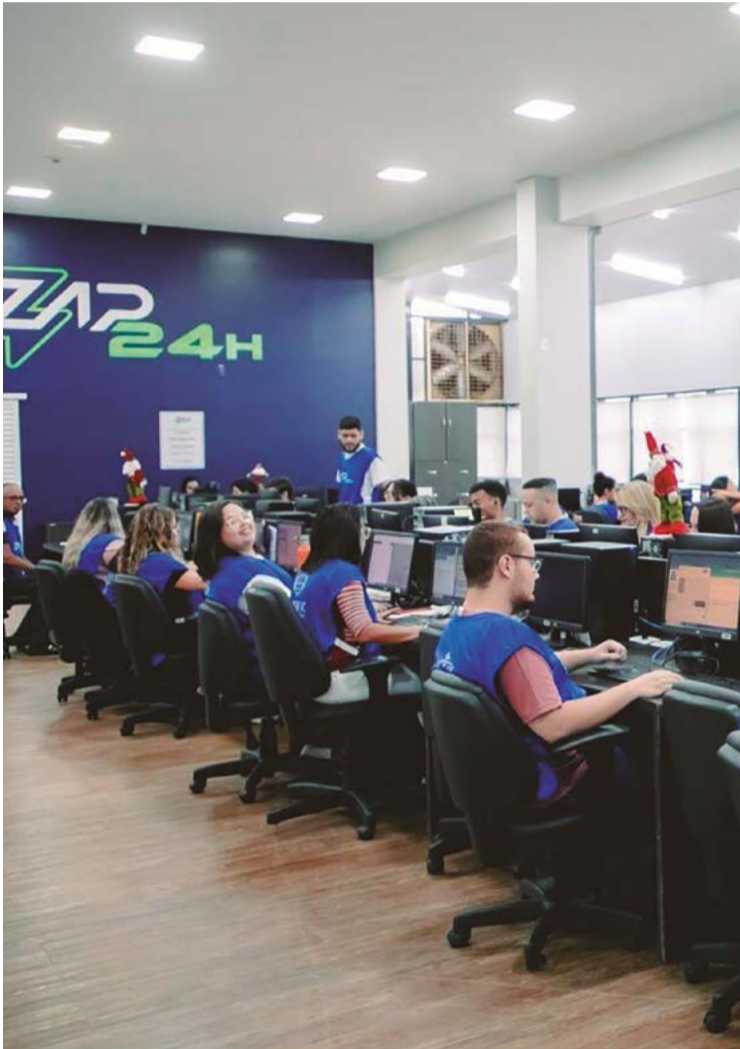
Assim que aciona o Zap 24h o cidadão interage com um dos quase 100 atendentes à disposição; demanda é solucionada em prazo satisfatório

Contudo, o novo perfil de modernidade e eficiência agra-