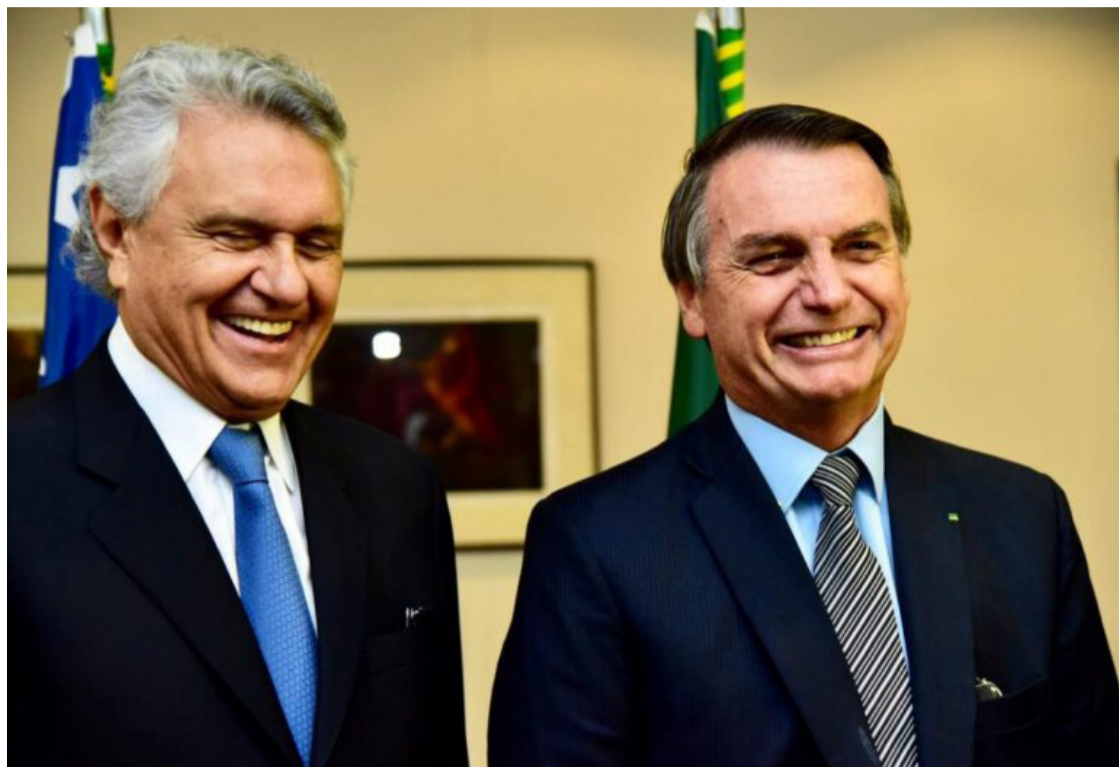
Ronaldo Caiado e Jair Bolsonaro: aliança entre União Brasil e PL em Goiânia

Esta aproximação com o PL faz parte do projeto de Caiado de ser candidato à presidência