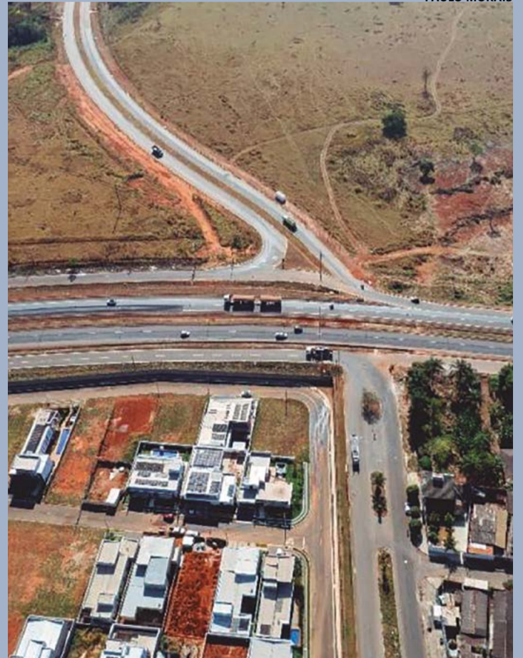
Motoristas que percorrem a região devem redobrar a atenção à sinalização e respeitar as orientações da Ecovias do Araguaia