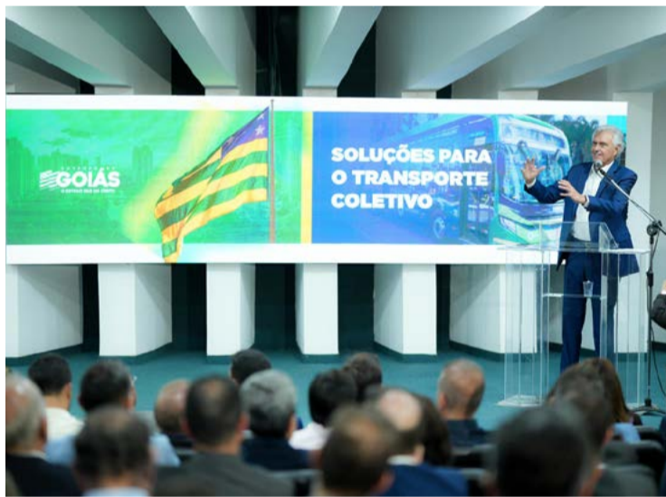
Governador Ronaldo Caiado e prefeitos buscam solução para transporte da região metropolitana

O Plano de Ação Imediata (PAI) receberá R$ 210 milhões para obras. Por sua vez, R$ 1,2 bilhão será encaminhado para a compra de nova frota de veículos. Segundo o anunciado na coletiva de ontem, ocorrerá também a recuperação e me-