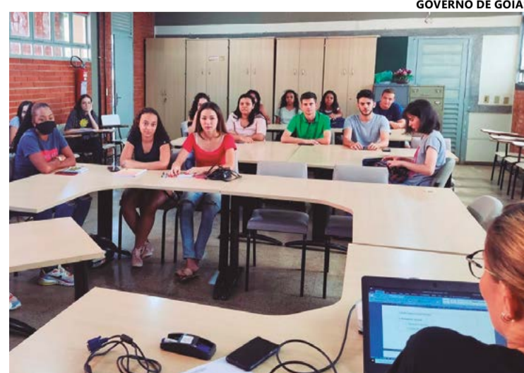
Primeira etapa do processo seletivo acontece no próximo dia 2 de fevereiro e consiste na análise dos documentos enviados pelos inscritos

O processo seletivo será realizado em formato remoto por meio do Google Meet. Serão considerados aprovados os candidatos que alcançarem nota superior a 7,0. O edital completo e os documentos necessários para inscrição estão disponíveis no site www.inovacao.go.gov.br .