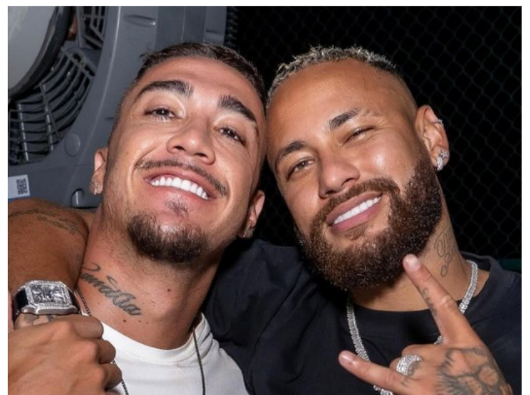
Neymar aparece nas imagens da festa de Romário com o rosto bem gordinho

Mesmo sem Neymar, o Al-Hilal vive bom momento nesta temporada sob o comando de Jorge Jesus. Além de liderar o Campeonato Saudita, o time foi vice-campeão da Copa dos Campeões Árabes, lidera o Campeonato Saudita, está nas oitavas de final da Liga dos Campeões da Ásia e na semifinal da Copa do Rei Saudita.