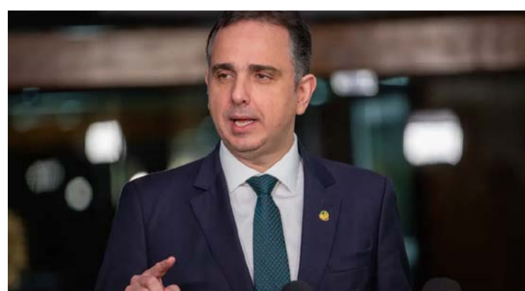
Rodrigo Pacheco (PSD/MG): congressistas monitorados clandestinamente pela Abin

Na semana passada, o ex-diretor da Abin e atual deputado federal, Alexandre Ramagem (PL-RJ), foi alvo de busca e apreensão por causa da investigação. A pressão de Pacheco acontece no dia em que a PF cumpre novos mandados de busca e apreensão, um deles contra o vereador do Rio de Janeiro Carlos Bolsonaro (Republicanos), filho do ex-presidente Jair Bolsonaro.