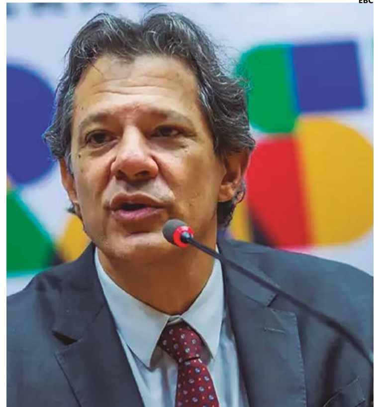
Ministro Haddad deve assinar nova versão do plano, com duas operações de crédito e alienação da CELGPar, e exclui venda de ações da Saneago

A revisão do RRF de Goiás também traz ressalvas anuais para gastos dos Poderes e órgãos com pessoal e foram incluídas como determina a lei do RRF. Em relação ao pagamento de serviço da dívida, o Governo prevê pagar R$ 1,2 bilhão em 2024, o que significa economia de R$ 1,3 bilhão por participar do Regime. (Com Secretaria da Economia)