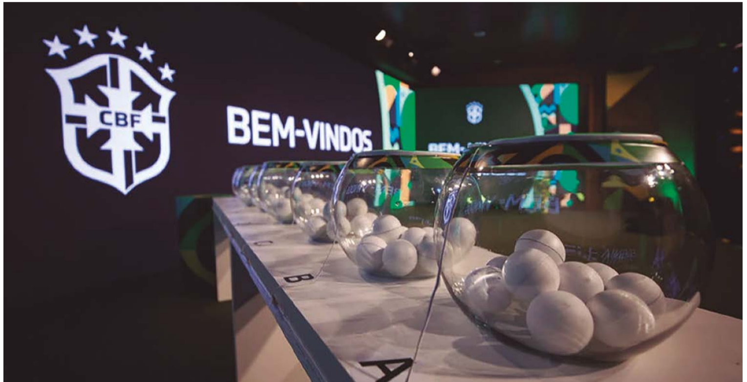
CBF marcou sorteio para às 15h, no Rio de Janeiro. Desafio promete ser grande, já que o Galo da Comarca pode pegar clubes das Séries A, B ou C

e vai pegar alguma equipe do grupo B, que tem times das Séries A, B e C. Os possíveis adversários tricolores são Juventude, Tombense, Sport, Ituano, CRB, Operário-PR, Criciúma, ABC, Sampaio Corrêa e Remo. Destes, Juventude e Criciúma estão na elite do futebol brasileiro. Sport, Ituano, CRB e Operário-PR jogam na Série B, e os demais disputam a Série C nacional em 2024.