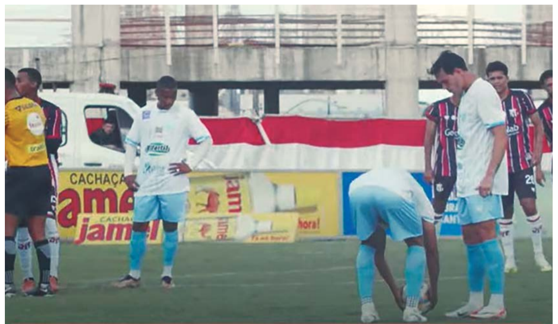
Em quatro jogos Tricolor soma duas derrotas, um empate e apenas uma vitória; próximo adversário é o Atlético